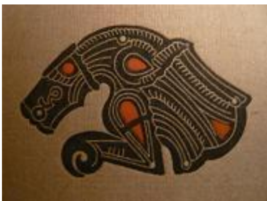
Logo Tungrii ( www.tungrii.nl )