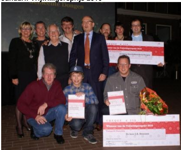
Januari: Vrijwilligersprijs 2010