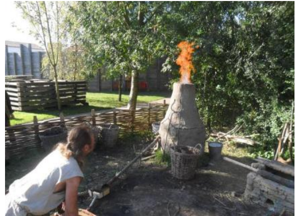
Oktober IJzerwinnen in Archeon