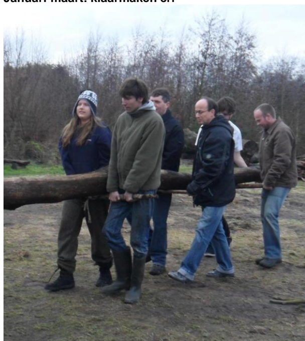
Januari-maart: klaarmaken erf