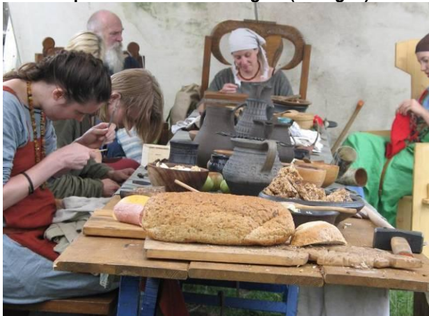
3 en 4 september: bezoek "Tungrii" (Vikingen)