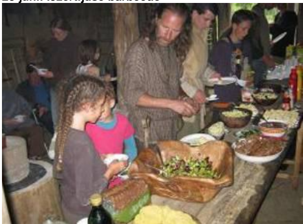
25 juni: IJzertijdse barbecue