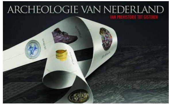
9 oktober: bezoek aan tentoonstelling Archeologie van Nederland in het Rijksmuseum voor Oudheden te Leiden