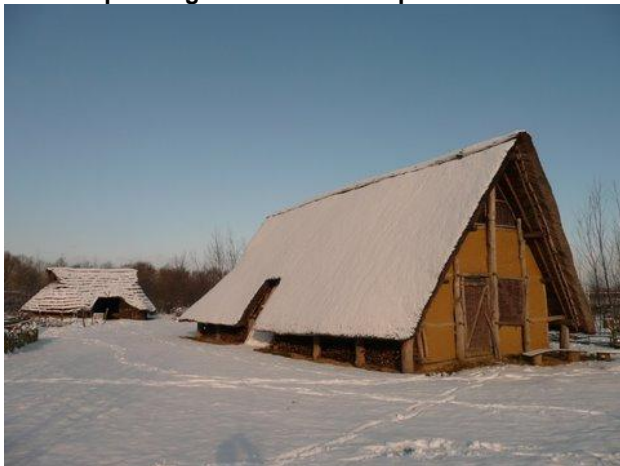
Januari: prachtig sneeuwlandschap