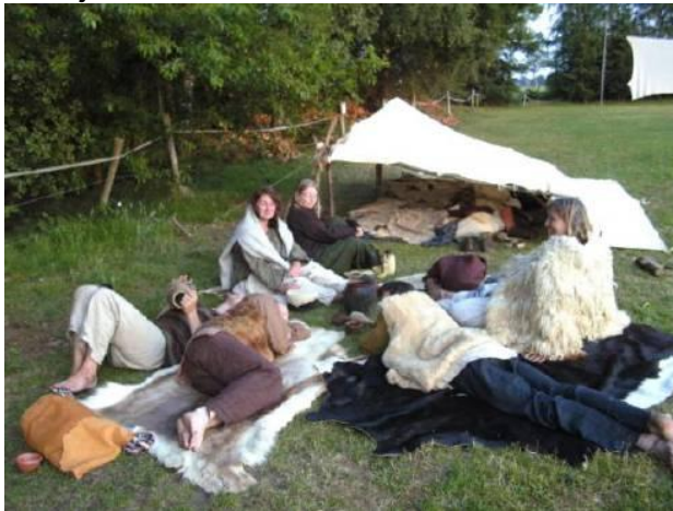
11-13 juni: Prehistorische voettocht