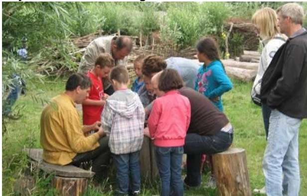
13 juni: Verrassend Dongen