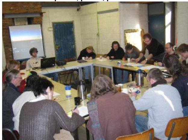
Januari-maart: praten, praten, praten