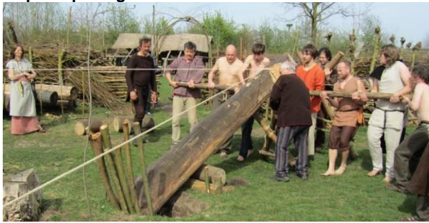
2 april: opening seizoen