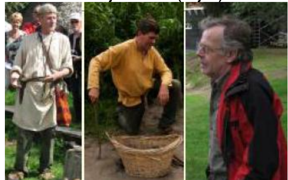
November: Eerste jubilarissen (10 jaar)