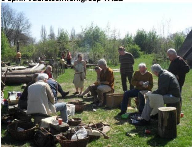
9 april: Vuursteenwerkgroep VAAE